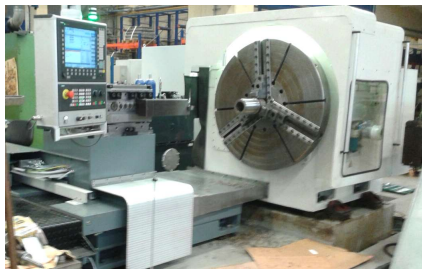
ZERBST DP 1 CNC (Foto ohne Schutzhaube)

Drehdurchmesser 1250 mm Werkstückgewicht 3 t Z Bettschlittenweg 1020 mm Hauptantrieb 81 kW Drehzahl stufenlos 1,4 - 450 U/min Planscheibe 1000 mm Werkstücklänge 500 mm X Querschlittenweg 900 mm Drehmoment max. 25 kNm Vorschübe 6000 mm/min