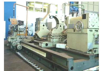
ZERBST DP 1 S/3 x 5000

Sonderpreis 79 TEUR frei verladen! Modernisierung auf Anfrage!