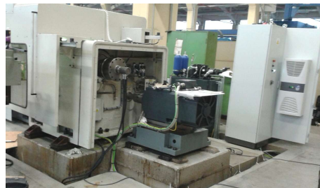
ZERBST DP 1 CNC